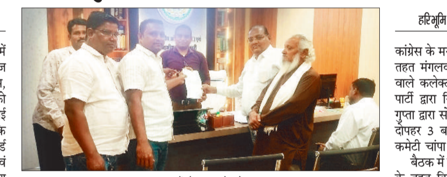
ज्ञापन सौंपते समाज के लोग।

ग्राम कोटमीसोनार में मतदाता सूची में विसंगति को लेकर गांव के मुस्लिम समाज के लोगों ने सामूहिक रूप से एसडीएम, तहसीलदार एवं पुलिस अधिकारियों को जापन सौंपकर जांच और वैधानिक कार्रवाई की मांग की है। जापन में बताया गया है कि विशेष गहन पुनरीक्षण प्रक्रिया के दौरान वार्ड क्रमांक 13, 14, 15 एवं 16 के कई वैध एवं पंजीकृत मतदाताओं के नाम हटाने के उद्देश्य से फर्जी एवं त्रुटिपूर्ण आपतियां दर्ज कराई गई हैं।