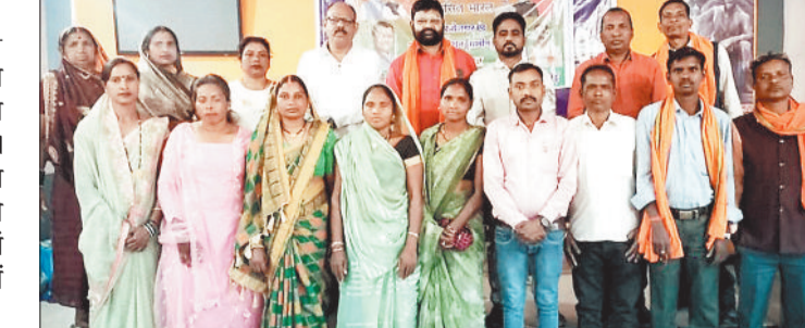
कार्यशाला में शामिल अतिथि व अन्य।