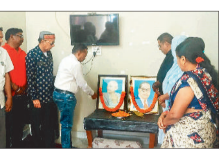
राष्ट्रपिता व अंबेडकर के छायाचित्र पर माल्यार्पण करते कांग्रेसजन।