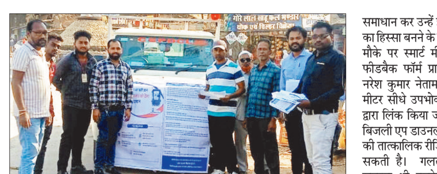
जागरूकता रैली में शामिल विभाग के कर्मचारी।

भारत सरकार के विद्युत मंत्रालय के निर्देशानुसार उपभोक्ताओं में स्मार्ट मीटर संबंधी जागरूकता के लिए 9 से 23 फरवरी तक स्मार्ट मीटर पखवाड़े का आयोजन किया जा रहा है। अकलतरा क्षेत्र के अंतर्गत सभी वितरण केंद्रों में अलग-अलग ग्रामों के विभिन्न क्षेत्रों में स्मार्ट मीटर का कैंप लगाकर जीनस कंपनी एवं विद्युत विभाग के संयुक्त प्रयास से जागरूकता हेतु जानकारी प्रदान की जा रही है। शिवरीनारायण शहर में 16 फरवरी को स्मार्ट मीटर पखवाड़ा का सफलतापूर्वक आयोजन किया गया। स्मार्ट मीटर पखवाड़े के तहत एक प्रभावी उपभोक्ता जागरूकता कार्यक्रम संपन्न हुआ, जिसमें