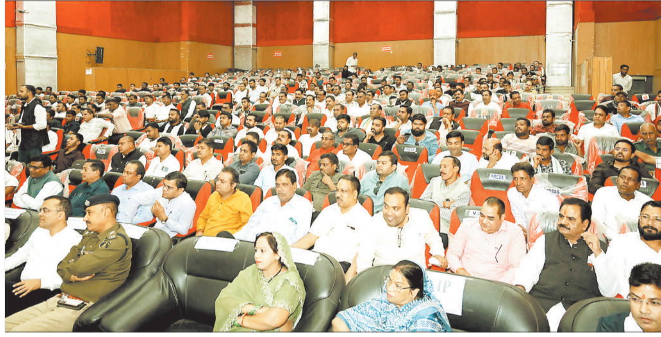
ऑडिटोरियम में आयोजित जिला संवाद कार्यक्रम में उपस्थित जनप्रतिनिधि, अधिकारी एवं नगरवासियों की भीड़।