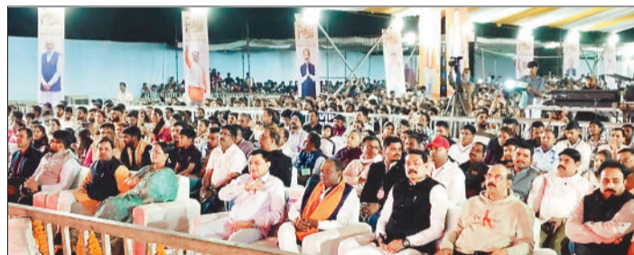
महोत्सव में अतिथि एवं नागरिकगण।