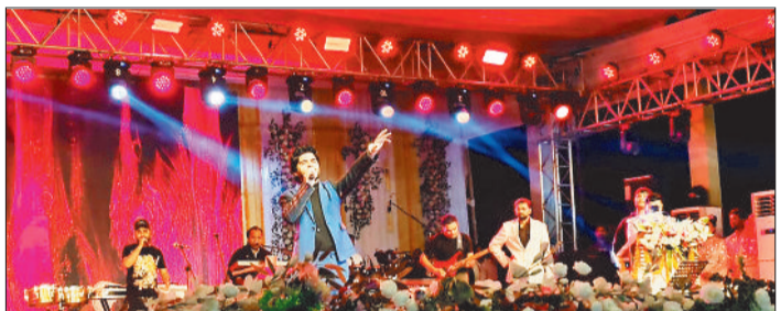
कार्यक्रम की प्रस्तुति देते कलाकार।