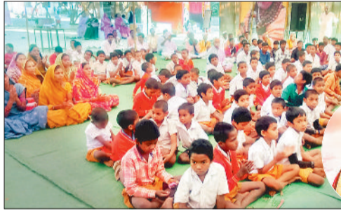
कथा श्रवण करने पहुंचे श्रद्धालु एवं कथावाचन करते कथावाचक।