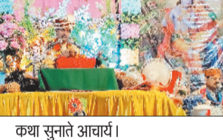
कथा सुनाते आचार्य।

अपने बाल सखा श्रीकृष्ण से मिलने के लिए द्वारिका पहुंचे, सुदामा महल की ओर बढ़ने लगे तब द्वारपालो ने सुदामा को भिक्षु समझकर रोक दिया। सुदामा ने द्वारपालो से कहा कि वह कृष्ण के बाल सखा सुदामा है, इस पर द्वारपाल महल में गए और प्रभु कृष्ण से कहा कि कोई उनसे मिलने आया है और अपना नाम सुदामा बता रहा है। श्रीकृष्ण ने अपने सामने सुदामा सखा को देखकर सुदामा को अपने सीने से लगा लिया। सुदामा ने भी कन्हैया कन्हैया